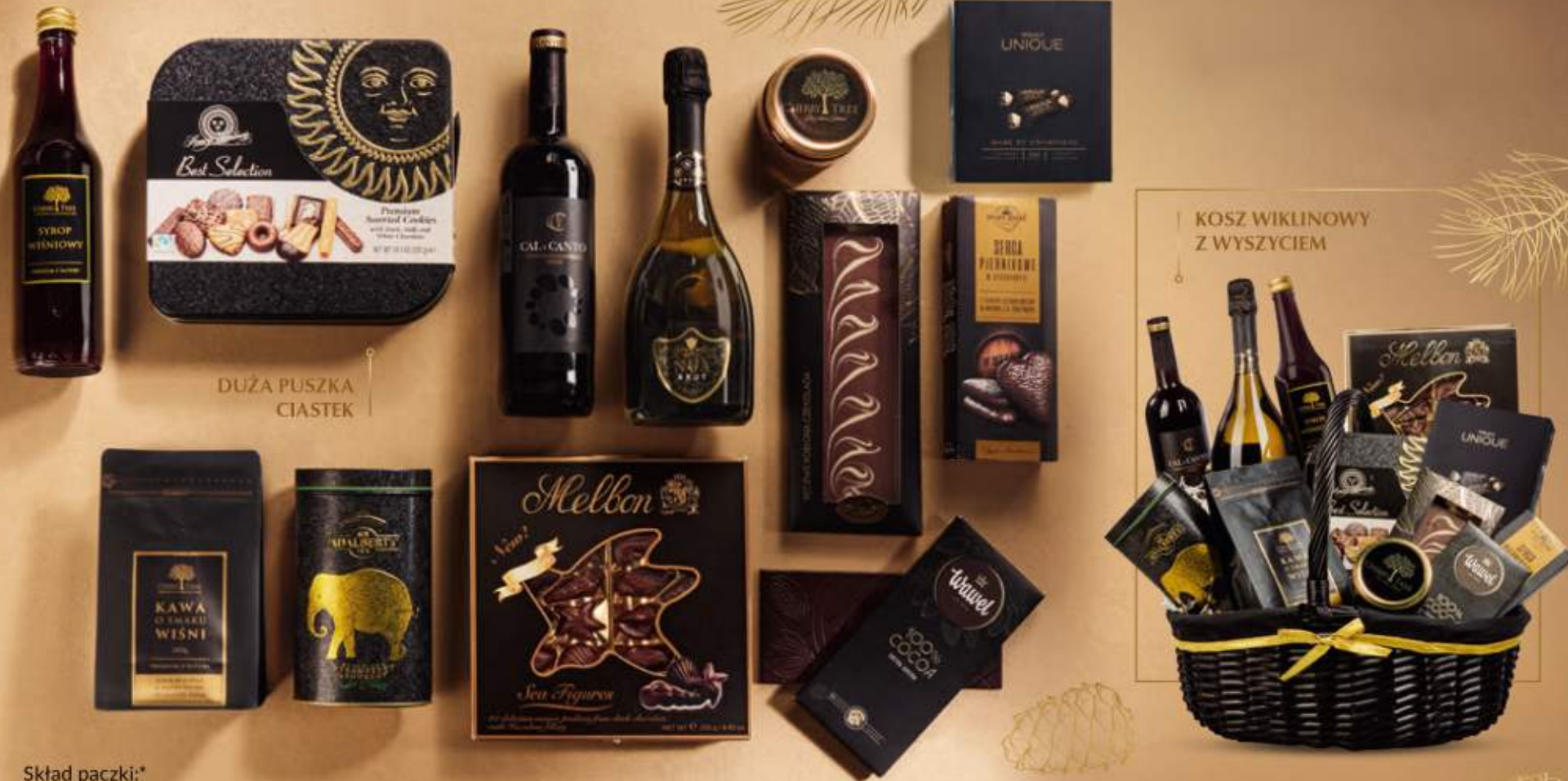
DUŻA PUSZKA CIASTEK