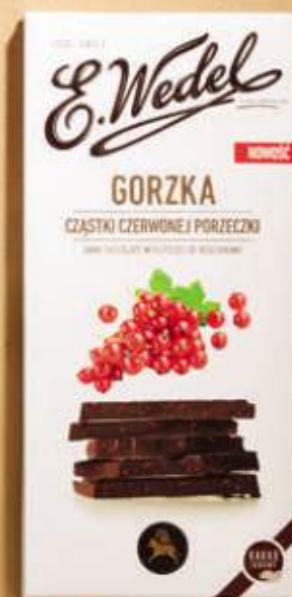
TRADYCYJNA DOMOWA RECEPTURA