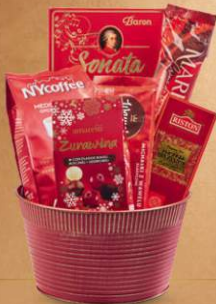
OZDOBNY METALOWY KOSZ